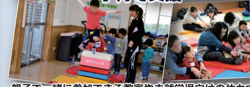
親子で一緒に参加できる教室や未就学児向けの体力づくり教室などを実施しています。