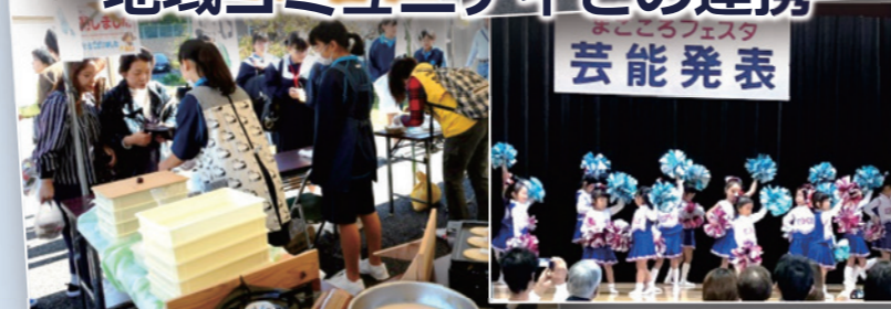
地域コミュニティ会議や自治区が主催するイベント等でスポーツ体験会などを行っています。