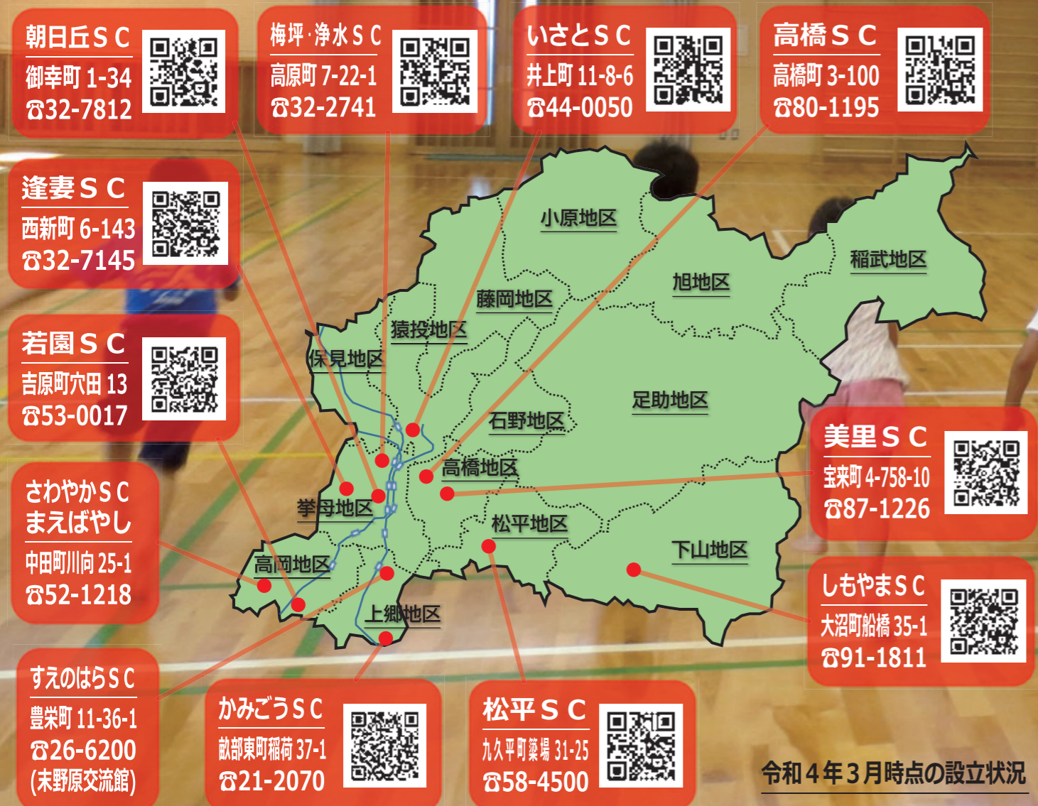
令和4年3月時点の設立状況

国が育成を進める「総合型地域スポーツクラブ」として、豊田市では平成15年より設立され、現在では12のクラブが活動。多世代・多種目・多志向という特徴を持ち、地域住民により自主的・主体的に運営されています。