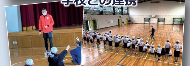
市内小学校にオリンピックによる走り方教室を実施しています。