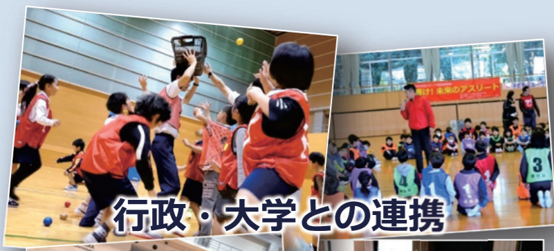
行政・大学との連携