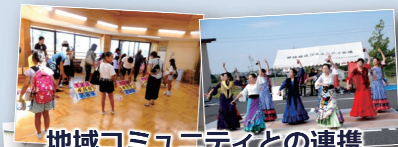
地域コミュニティとの連携