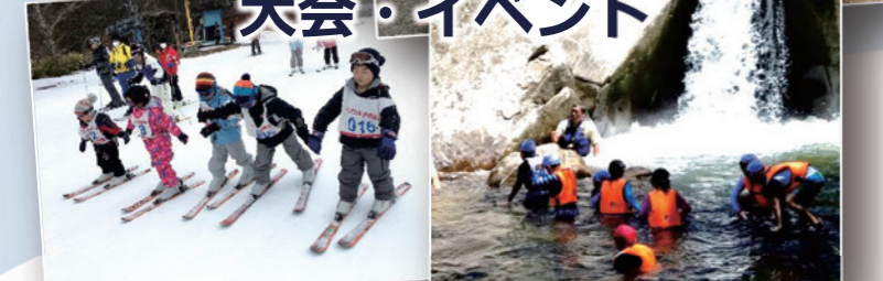
マラソン大会や地域住民を対象とした運動会、子ども向けのイベントなどを開催しています。