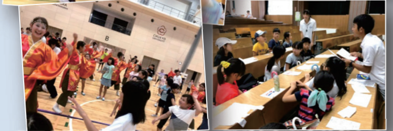
豊田市や中京大学と連携して子どもから高齢者向けの事業を展開しています。