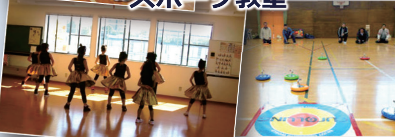
様々なスポーツ種目の定期的な教室を幅広い世代を対象に実施しています。