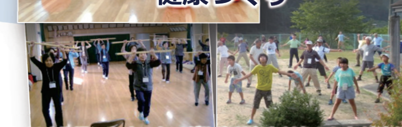
ラジオ体操・ウォーキングや高齢者を対象とした健康体操教室を開催し、地域住民の健康づくりを行っています。

【 豊田市地域スポーツクラブ 問合せ先 】 公益財団法人豊田市スポーツ協会 電話: (0565) 31-0451 / FAX: (0565) 35-4773