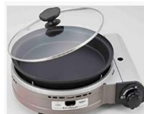
イワタニ ビストロの達人Ⅲ