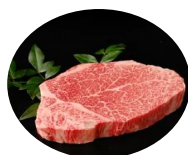
国産牛 シャトーブリアン200g

金賞 6カ所以上探検 合計5名様 銀賞 4～5カ所探検 合計10名様 銅賞 2～3カ所探検 合計20名様