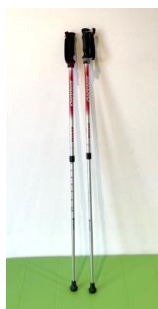
ウォーキングポール