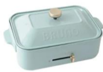
ブルーノ ホットプレート