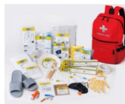
防災グッズセット